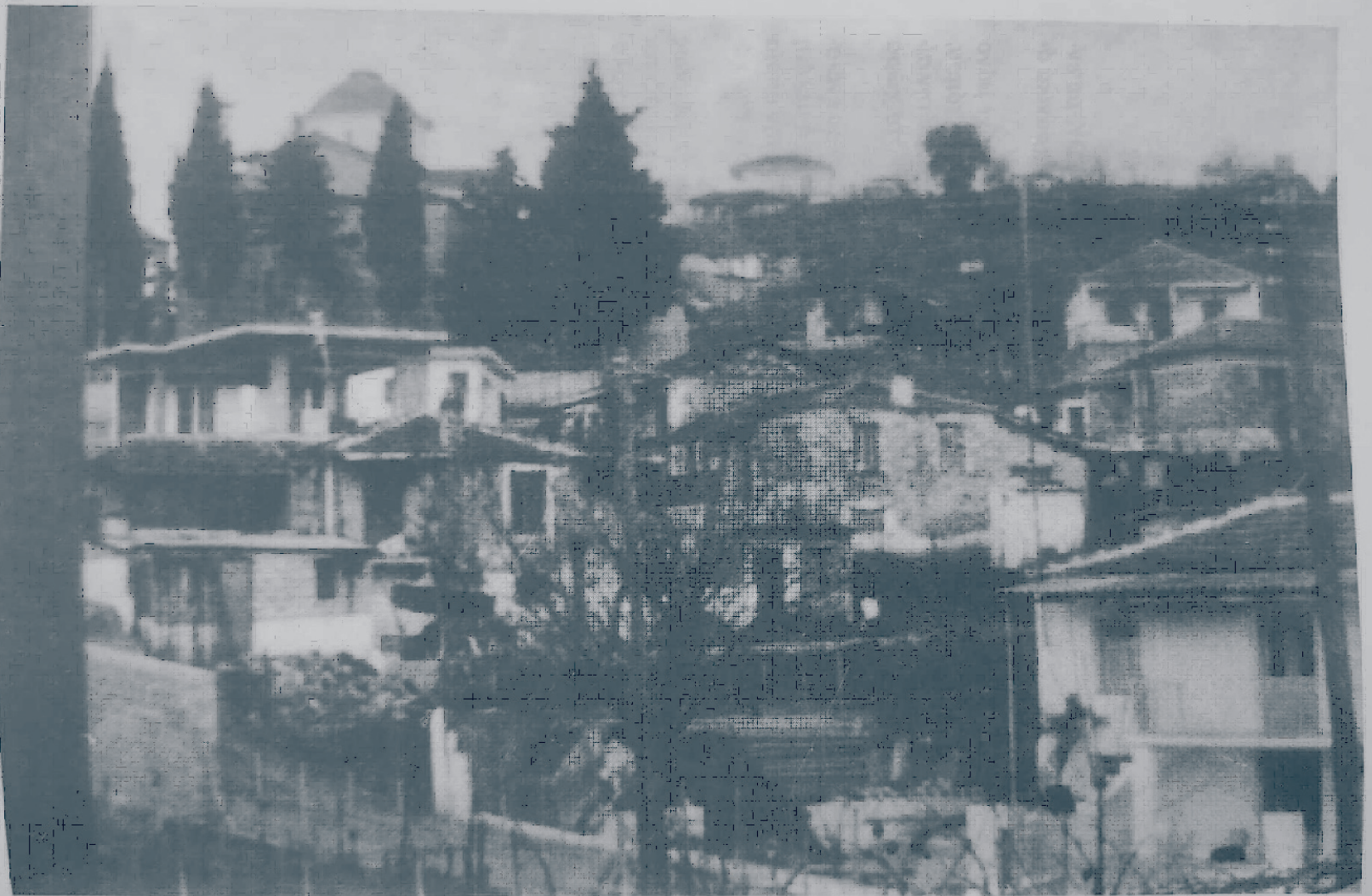
Μακρυρράχη (Καΐτσα), μερική άποψη (φωτ. Κ. Κούτσικας, 1991).

(Αναδημοσίευση από τα ΧΡΟΝΙΚΑ ΤΗΣ ΕΠΑΡΧΙΑΣ ΔΟΜΟΚΟΥ, ΤΟΜΟΣ 5)